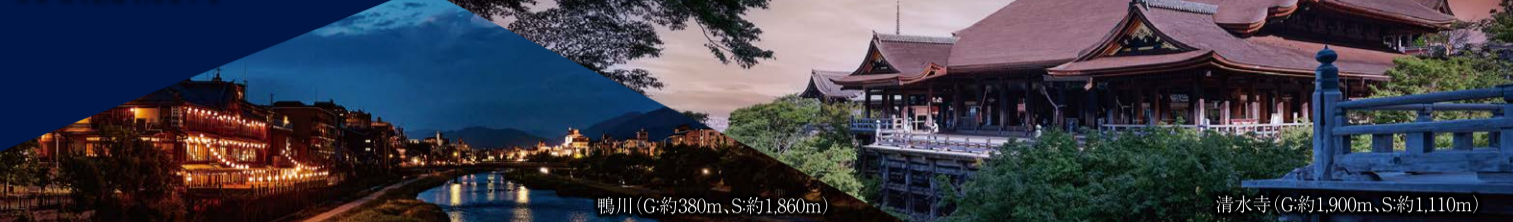
鴨川 (G約380m, S約1,860m)

「まだまだ外出は控えたいけど分譲マンションに興味がある」というような方に、ご自宅からスマートフォンなどを通じて物件のご案内ができる「オンライン説明会」を開催いたします。ぜひご利用ください。