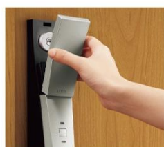
シリンダーカバー