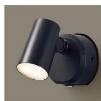
人感センサー照明