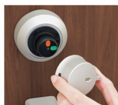
セキュリティサムターン